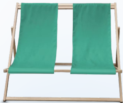
DUO z podwójną tkaniną