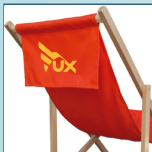
Dodatkowa powierzchnia reklamowa