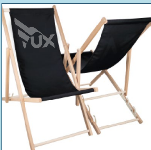
Możliwość druku z obydwu stron