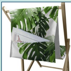
Kieszon na gazety