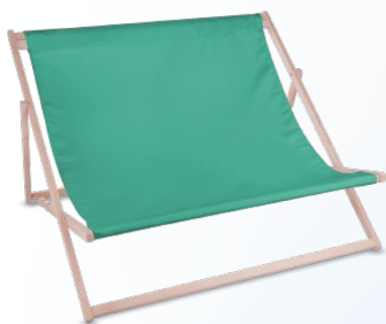
DUO z pojedynczą tkaniną