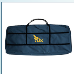
Pokrowiec na leżak