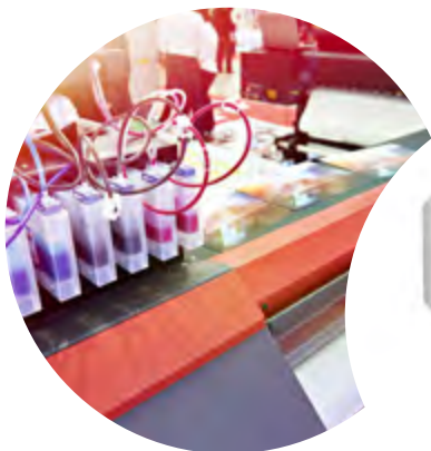
Farby do druku sublimacyjnego