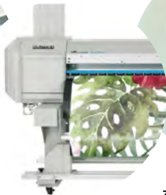
Nadruk grafiki na papier