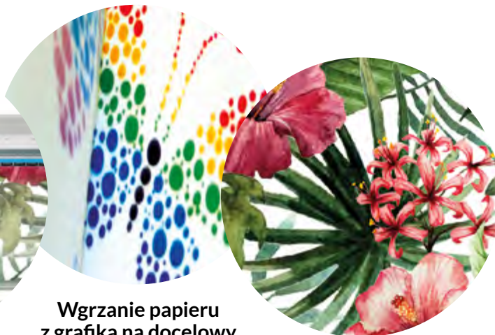
Wgrzanie papieru z grafiką na docelowy materiał